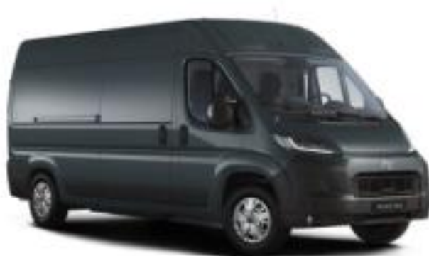
(EAB) Темно сива акрил