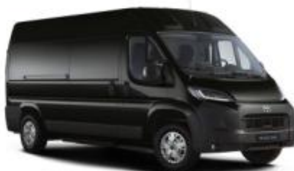
(ЕЕА) Црна металик