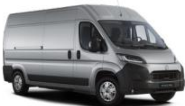
(КСА) Сребрена металик