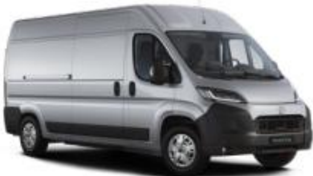
(EAK) Мистично сива металик