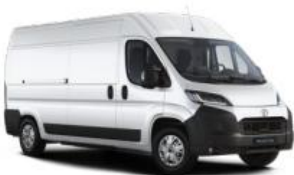
(EPR) Бела акрил